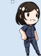
圖片來源：Yuki Carol、かわいいフリー素材集いらすとや(www.irasutoya.com)